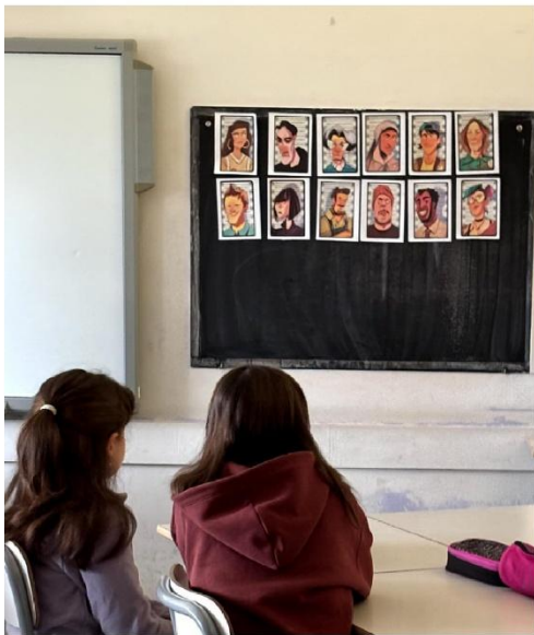
Oltre il sospetto Pietre d'inciampo di speranza