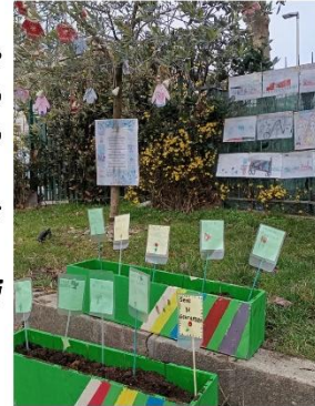
Seminare germogli di bene