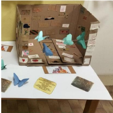
Trasformare macerie in bellezza

La speranza è una creatura alata che si viene a posare sull'anima e canta melodie senza parole senza smettere mai.