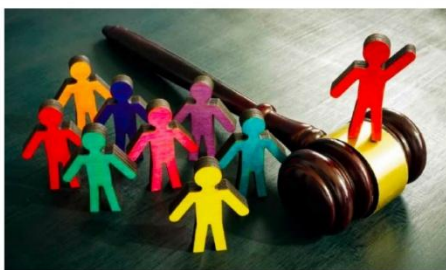
In Italia le scuole paritarie private scoloriscono circa il 30 per cento di tutti i bambini in fascia 3-6 anni

Nonostante i livelli di prestazioni molto elevati, frutto di una formazione continua, e una rete pedagogica di qualità, l'anno scorso oltre 200 scuole dell'infanzia hanno dovuto chiudere